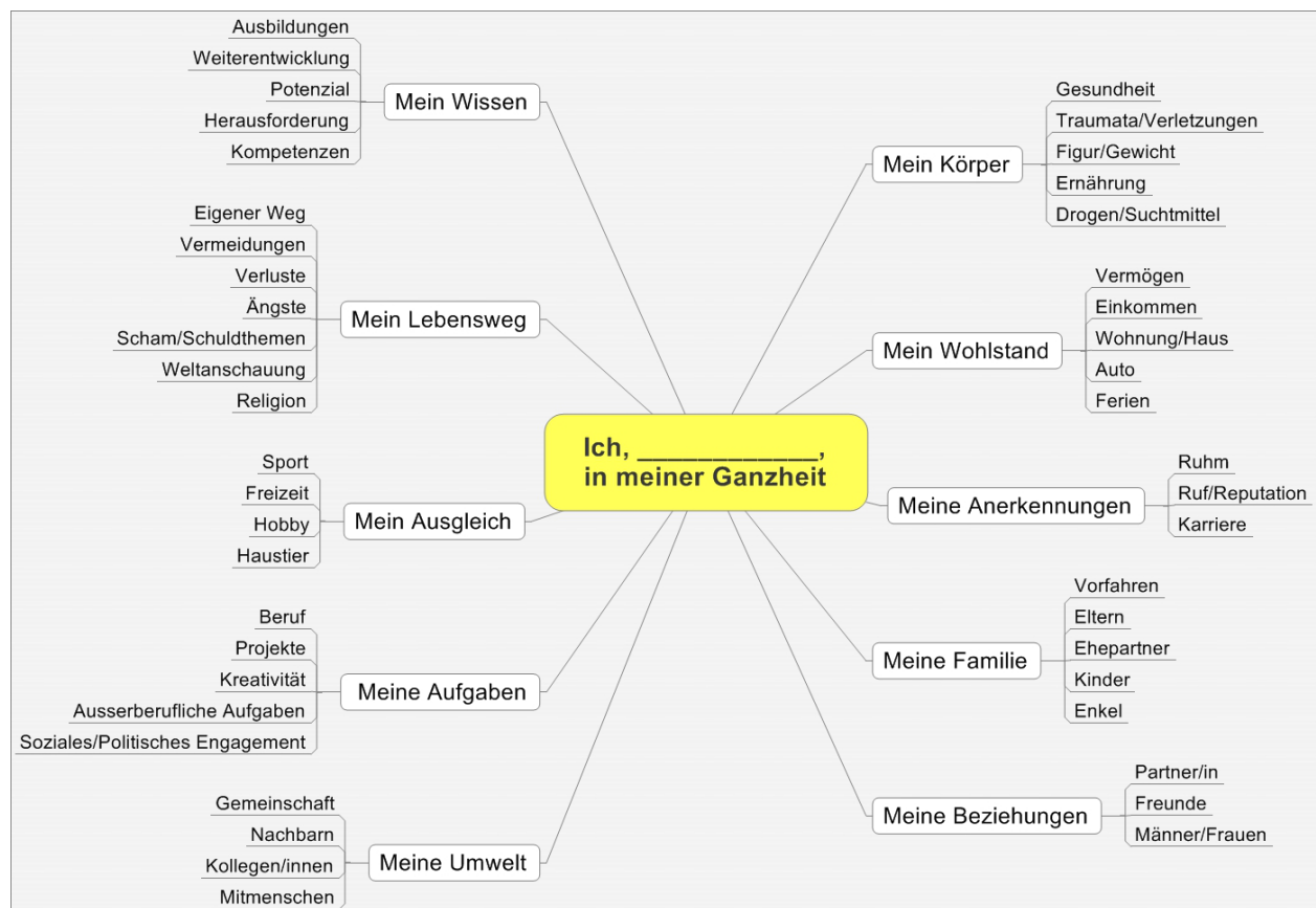
Abb.2 Beispiele für Themen innerhalb der Energiefelder.

Listen Sie alle Belastungen eines Energiefeldes auf und skalieren Sie es wieder mit einem Wert zwischen 0 (keine Belastung) bis 10 (starke Belastung).